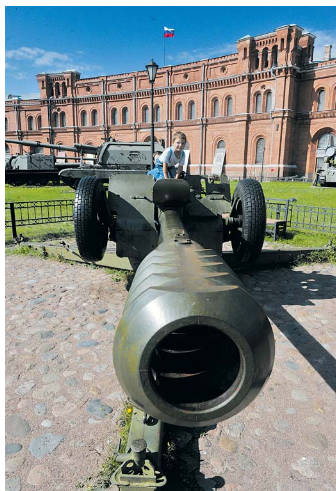
Старое, но грозное оружие.

Беседовал Алексей БЛАХНОВ