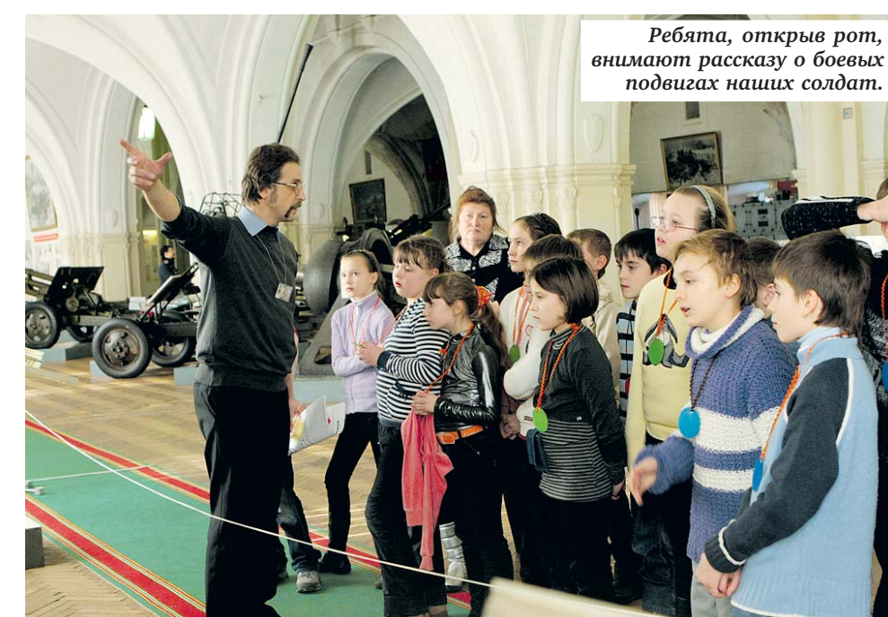
Ребята, открыв рот, внимают рассказу о боевых подвигах наших солдат.

— У нас весьма обширные оружейные фонды, и везде представлены подлинные вещи, у нас нет муляжей. Что же касается хранения, то, когда мы вынимали их из спецхрана, все оружие было в специальной смазке. За каждым оружейным предметом в музее кропотливо ухаживают. Если же говорить о боевом состоянии, то все это двухсотлетнее оружие способно стрелять и сейчас. Правда, чтобы из такого ружья выстрелить, нужен немалый навык. В то время уже были так называемые патроны, сформированные из бумаги и хранившиеся в патронной сумке. Бумажная гильза содержала заряд пороха, пыль и пулю. Чтобы выстрелить, нужно было выполнить несколько не свойственных современному стрелковому оружию операций. Была команда «заряжай!», на которую солдат вынимал из сумки бумажный патрон. Следующая команда звучала как «скуси патрон!». Солдат должен был сделать в бумажной гильзе дырочку, чтобы порох высыпался. Затем дырочка зажималась, патрон опускался в ствол, шомполом патрон прибивался так, чтобы бумага окончательно порвалась. На полочку ружья насыпался порох, для затравки, чтобы произошло воспламенение. Только после этого можно было стрелять! При нажатии на спуск курок бил по полке, высекая искру, искра попадала на порох на полке, с которой