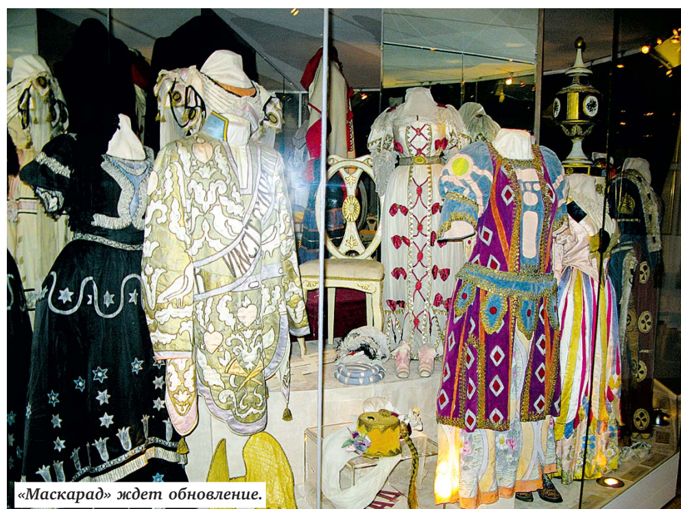
«Маскарад» ждет обновление.