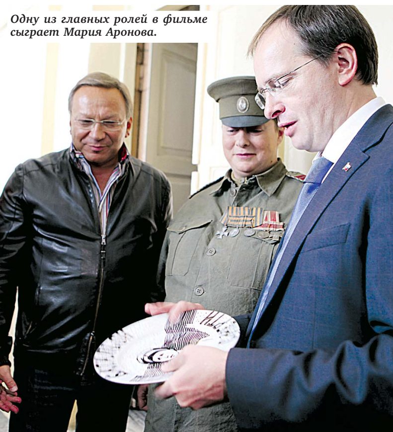
Одну из главных ролей в фильме сыграет Мария Аронова.