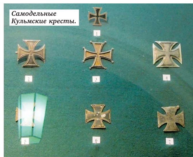
Самодельные Кульмские кресты.

ввиду чего коллекция понесла ощутимые потери. Вторая эвакуация — в 1941-м — прошла более гладко, и почти все удалось сохранить. Мало кто знает, что здесь, в этом здании, в блокадном Ленинграде оставалась команда из 25 человек, чтобы присматривать за теми экспонатами, которые увезти не удалось, и за самими помещениями. Трагедия в том, что в живых остались только пятеро наших сотрудников, остальные погибли. Поэтому данная выставка посвящается не только доблести наших воинов, сражавшихся при Кульме, но и вообще всем тем, кто защищал нашу родину и ее историческое наследие.