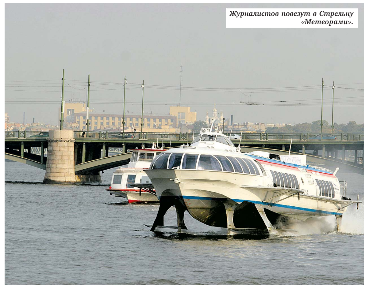
Журналистов повезут в Стрельну «Метеорами».

Переезд между точками будет осуществляться для журналистов на электрокарах, под присмотром охраны.