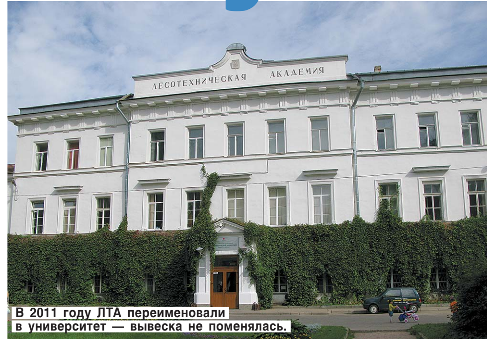
В 2011 году ЛТА переименовали в университет — вывеска не поменялась.