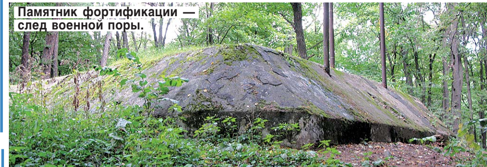
Памятник фортификации — след военной поры.