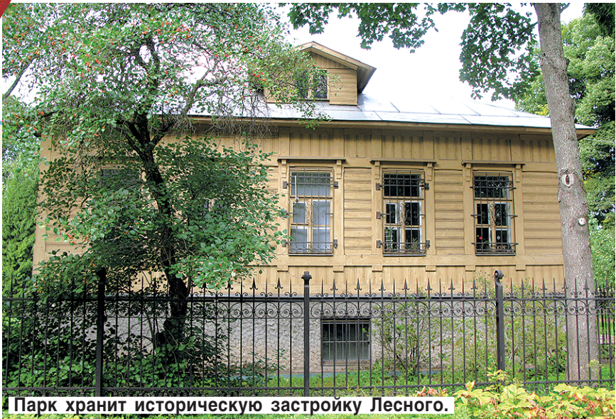
Парк хранит историческую застройку Лесного.

Старожилы живут здесь же, в деревянных домиках с мезонинами. На всех домиках один адрес: Институтский переулок, 5. С корпусами. Есть еще таблички про злых собак, но все собаки в парке — мирные, приличных, воспитанных пород. Гуляют на поводках при хозяевах. Мифические злые — предупреждают вход на ценные территории, где в дендрариях растут ценные деревья, цветы и кустарники для их приумножения на скудных почвах нашего болотистого региона. Глядишь, пройдет время — и у нас будет как у северных соседей, в благоухоющей южной растительностью Финляндии. Надо только набраться терпения и подождать, когда в практику зеленого строительства внедрят новые, индуцированные растения.