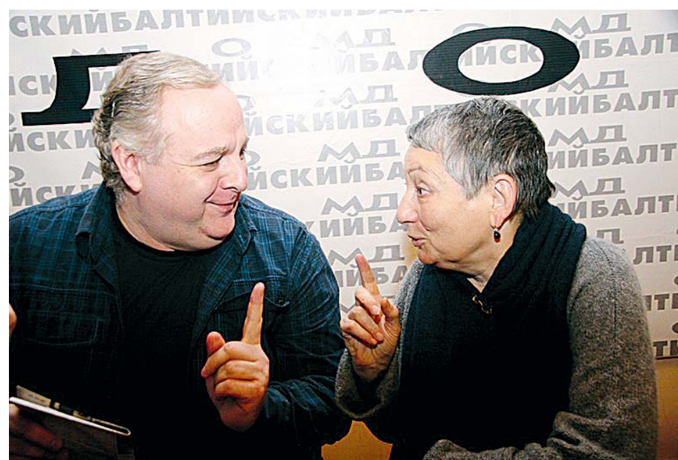
Анджей Бубень и Людмила Улицкая поставят новый спектакль в октябре.

ПИСАТЕЛЬ И ТЕАТРАЛЬНЫЙ РЕЖИССЕР НАЧАЛИ РАБОТУ НАД СПЕКТАКЛЕМ ПО КНИГЕ «ДЕТСТВО 45 — 53: А ЗАВТРА БУДЕТ СЧАСТЬЕ»