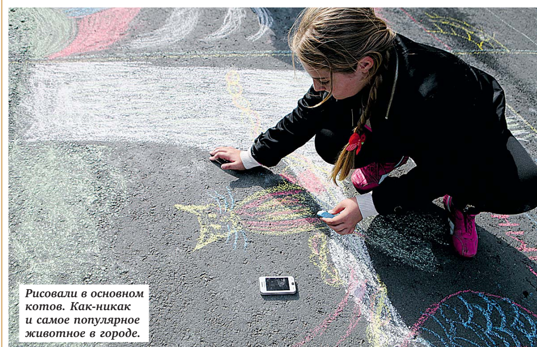
Рисовали в основном коты. Как-никак и самое популярное животное в городе.

начала свою репутацию с четырех годиков, когда полюбила лошадей. Рисовала их и рисовала.