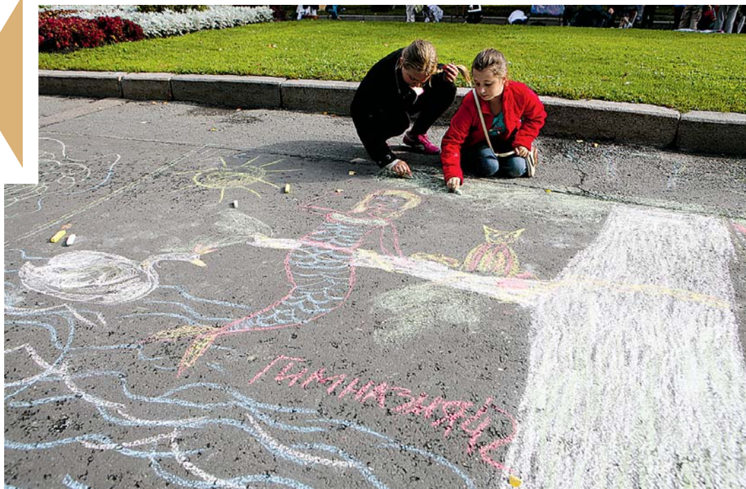
«Морская фигура, на месте замри!».

Кленовую аллею перед замком расчертили заранее мелками на квадраты. Всю ее дети смогут заполнить своими рисунками.