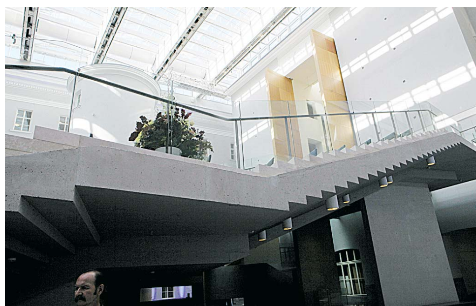
Одна из «фишек» нового помещения — оригинальное освещение.

ПОТОМУ ЧТО ПОСЛЕ ОТКРЫТИЯ ГЛАВНОГО ШТАБА В 2014 ГОДУ, К 250-ЛЕТИЮ ЭРМИТАЖА, ВТОРОГО ТАКОГО МУЗЕЯ ПО МАСШТАБУ НЕ БУДЕТ ВО ВСЕМ МИРЕ