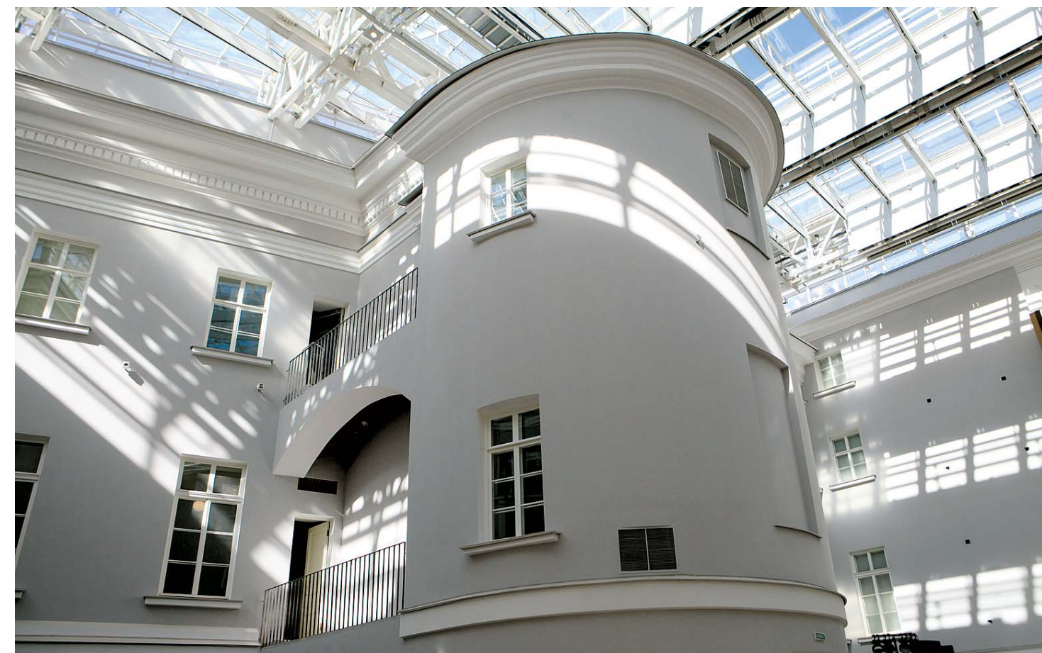
Высота потолков зашкаливает и подходит для представления самых крупномасштабных произведений искусства.

Главный архитектор проекта и руководитель «Студии-44» Никита Явейн рассказал, что именно отсюда по величественной так называемой церемониальной лестнице, которая при необходимости сможет трансформироваться в амфитеатр, посетители будут заходить в музей. В полуподвале разместятся кассы, турникеты, гардероб, музейные магазины, информационные стойки. На первом этаже — кафе и мультимедийный выставочный комплекс.