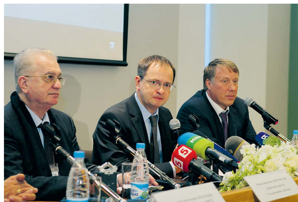
Михаил Пиотровский, Владимир Мединский и представитель строительной организации.