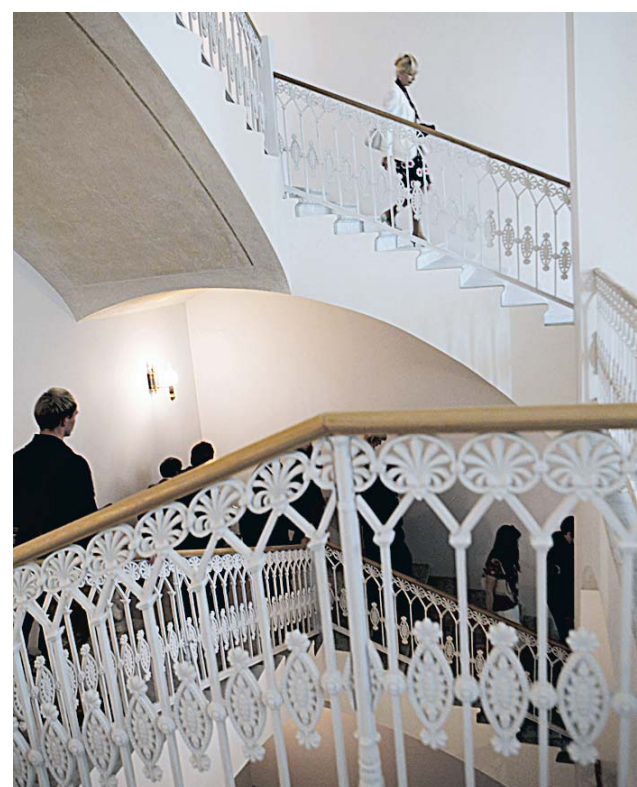
Еще недавно по этим лестницам ходить было опасно для жизни.

● Как сообщил Михаил Пиотровский, полностью Восточное крыло — вместе с экспозицией — будет готово к концу 2014 года, к празднованию 250-летия Государственного Эрмитажа.