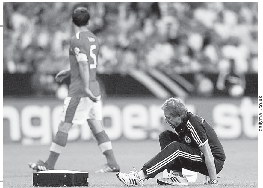
Падают на футбольном поле не только игроки...

Впрочем, выздоровление его будет проходить на хорошем эмоциональном фоне, ибо немцы разгромили австрийцев — 3:0 — и безоговорочно лидируют в группе С.