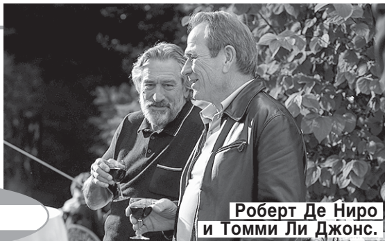
Роберт Де Ниро и Томми Ли Джонс.