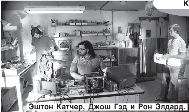
Эштон Катчер, Джош Гэд и Рон Элдарт.