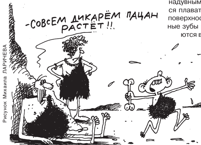
Рисунок Михаила ПАРИЧЕВА

«Рот, рот закрой, говорю, вода упадет!» — в очередной раз говорит мужчина, оказавшийся папой. Его привычное лицо становится просто трогательно сосредоточенным. Напор в выражениях — просто некоторая боязнь за чадо. И все это есть не что иное, как урок плавания. И мужчина, оказывается, просто самый лучший, то есть совершенно обыкновенный папа. А я — просто балда, и надо мне грести отзадова.