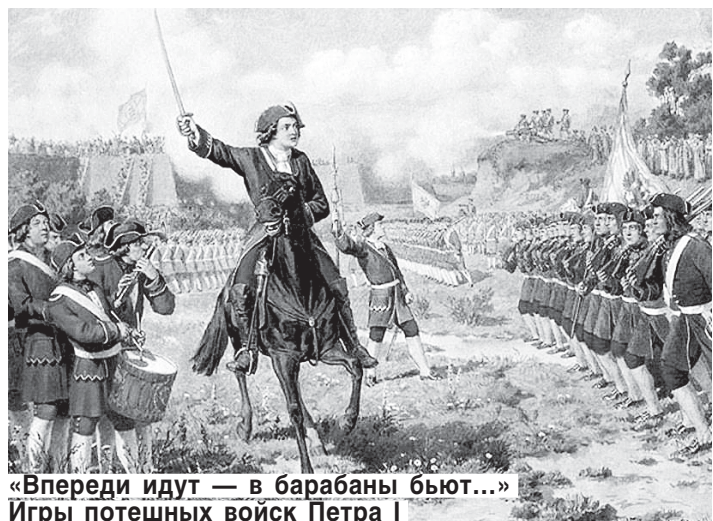
«Впереди идут — в барабаны бьют...» Игры потешных войск Петра I (художник Алексей Кившенко, 1880 год).

У Фике опять появилось достаточно времени для досуга и раздумий. А печальные смерти и веселые марьяжи только разжигали страсть к экскурсам в давнее и недавнее прошлое. Оно, это прошлое, словно магнит манило пытливого ума и растрепанную душу великой княгини.