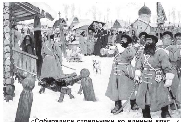
«Собирались стрельчики во единый круг...» Московские стрельцы (художник Сергей Иванов, 1907 год).

Сойдя со взмыленной лошади, царь — после 60 верст непрерывного пути — выглядел едва живым от усталости и напряжения. И хотя страхи оказались ложными (Софья всего лишь вознамерилась в энный раз помолиться под сводами Донского монастыря), Петр, по словам знаменитого пред-революционного историка Сергея Платонова, страдал с той поры от постоянной нервной встряски. У него дергались щеки, по-