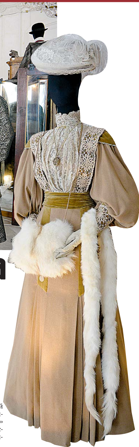
Костюм главной героини фильма «Сонька — Золотая Ручка».

— К счастью, сегодня кинопроизводство стало весьма интенсивным. Художники по костюмам востребованы. А ког-