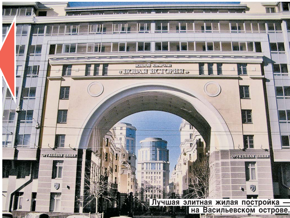
Лучшая элитная жилая постройка — на Васильевском острове.

Среди проектов, завершенных петербургскими архитекторами, отметили проекты здания областного суда в Нижнем Новгороде и музейно-выставочного центра в Ухте. Место в тройке проектов-победителей занял также план перестройки