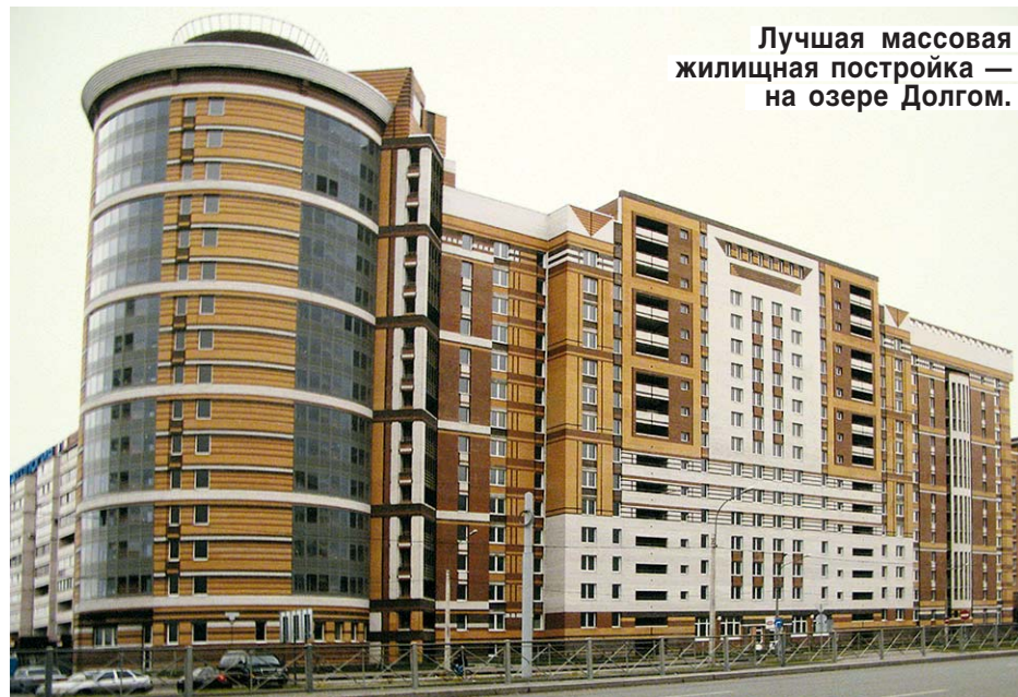
Лучшая массовая жилищная постройка — на озере Долгом.

текторы, выполнявшие заказ Управления делами президента РФ по реставрации Дома ветеранов сцены им. Савиной. Все работы — из разных «весовых категорий». В «Архитектоне-2014» этот недостаток обещают устранить, введя отдельные номинации за жилые дома, за культурные объекты, выполненные по государственному заказу, и так далее.