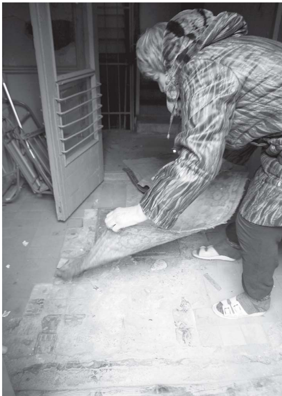
...полы — разбиты.