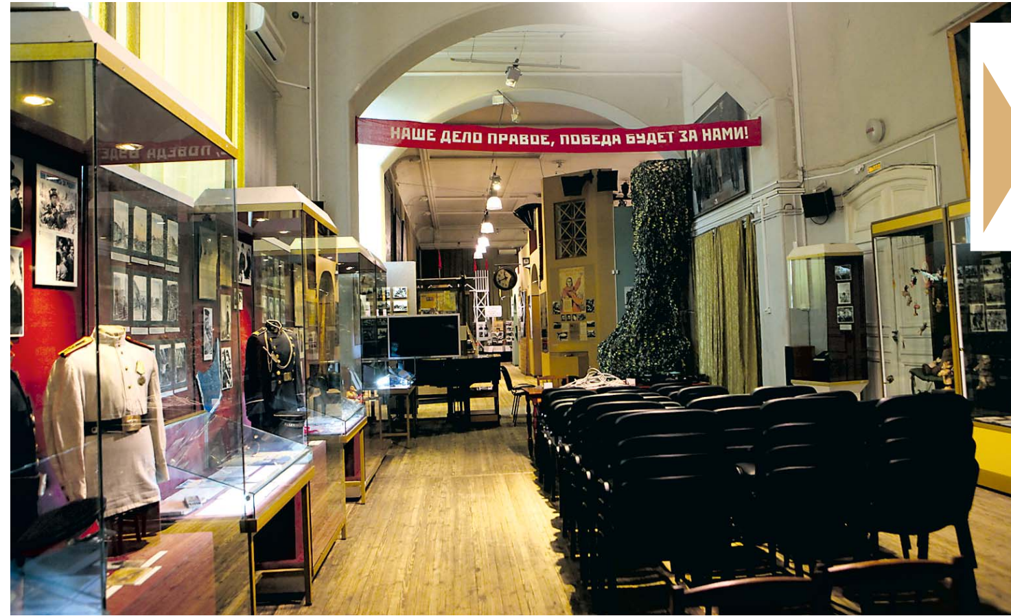
Экспозиция размещена в бывшем зале ленинградской промышленности.