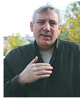
рос: а кто все это будет финансировать? Как все это сделать? Я не понимаю механизма реализации проекта, хотя мы и не против того, чтобы сделать грандиозный памятник блокаде, объединив усилия всех военных музеев.

— Музей создавался на пустом месте, и все, что вы здесь видите, привозилось, приносилось, дарилось ленинградцами, поисковиками, коллекционерами, что-то мы, конечно, купили — сегодня у нас 50 тысяч единиц хранения.