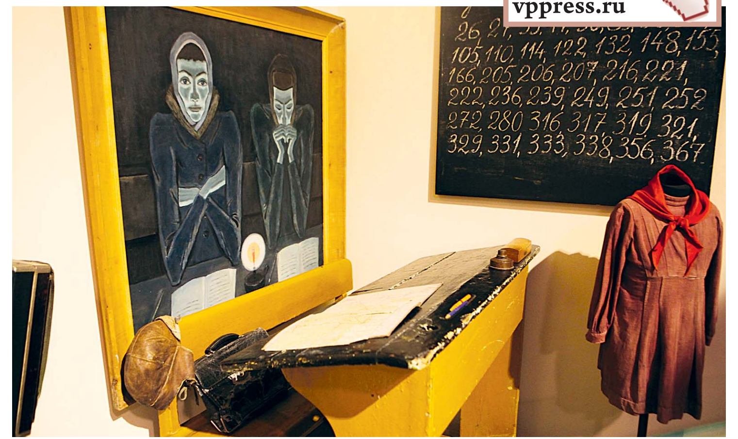
В блокадные дни в школах продолжали учить детей...

— Этот проект обсуждался несколько лет назад. Цена вопроса — 4,5 млрд. рублей. Но