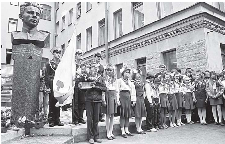
СССР. Ленинград. Торжественное открытие бюста Героя Советского Союза Александра Маринеско перед центральной проходной завода «Мезон» на Большом Сампсониевском, 28-а. 1990 год.