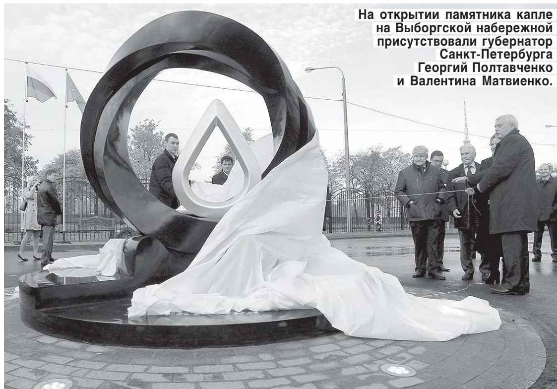
На открытии памятника капле на Выборгской набережной присутствовали губернатор Санкт-Петербурга Георгий Полтавченко и Валентина Матвиенко.

В зыбкой питерской почве соорудили настоящий подземный город. Сотрудники «Водоканала» утверждают, что ничего подобного не строилось ни в России, ни в мире. На глубине 90 метров (высота 35-этажного дома) смонтирован циклопический узел регулирования стоков. Также ликвидировано 10 ядовитых сливов в Неву.