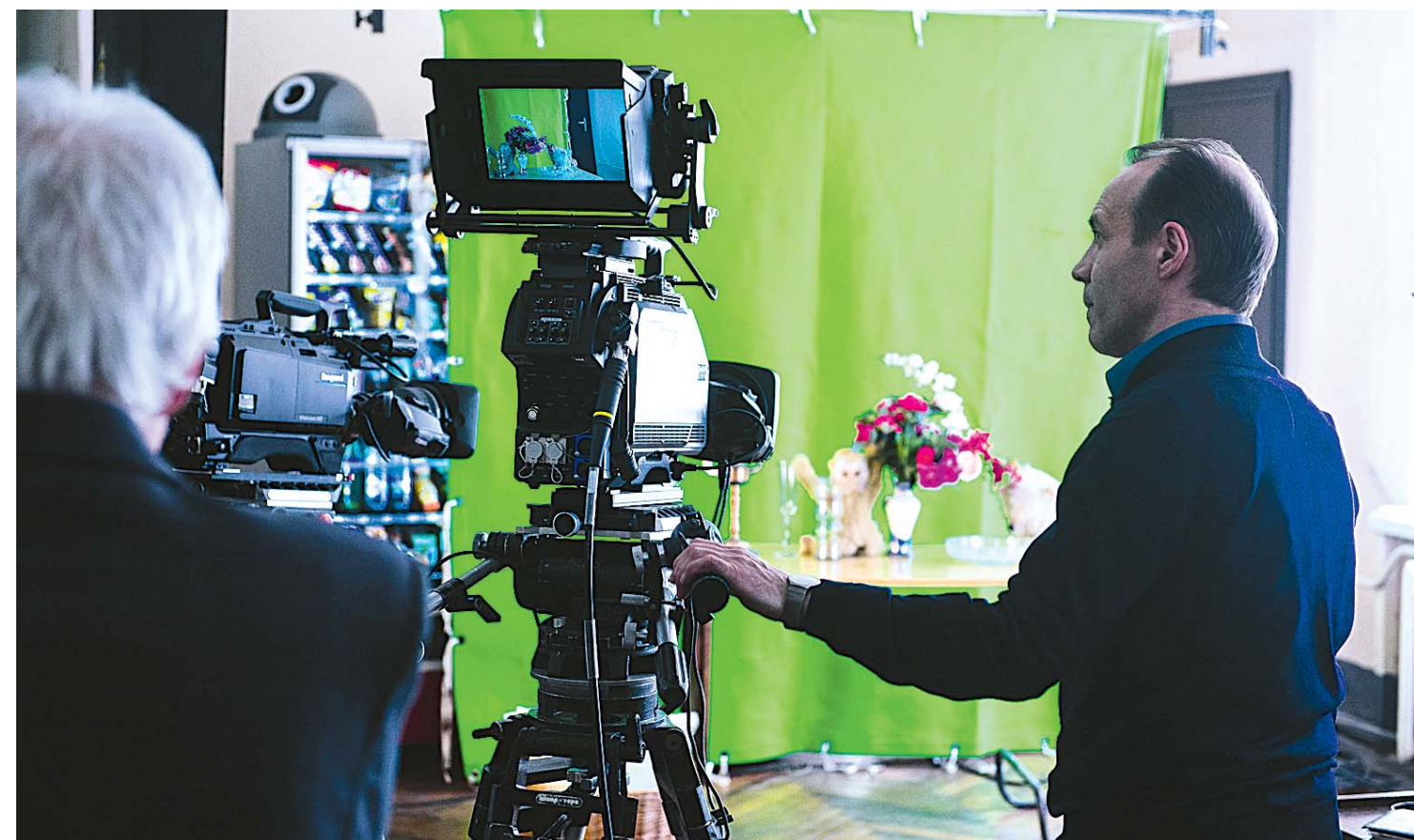
Киностудия запускает съемки сразу нескольких проектов.