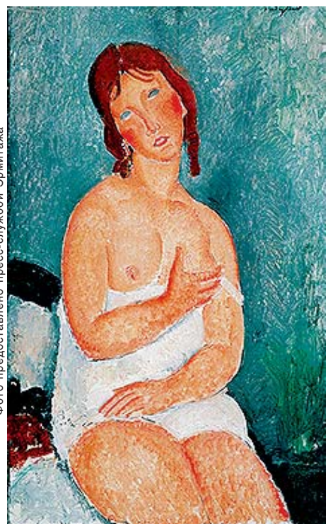
Амедео Модильяни. Молодая женщина в рубашке.