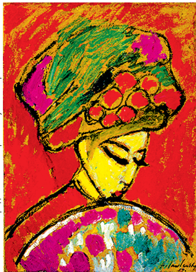
Алексей фон Явленский. Девушка в шляпе с цветами.

«Выставка показывает и тех художников, которых мы сейчас уже не воспринимаем как экспрессионистов, — сказал ди-