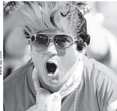
Фанат «Канзас-Сити Чифс» в момент установления мирового рекорда по фанатскому крику.

И хотя фанаты «Чифс» о попытке установления рекорда были оповещены заранее и на стадион был приглашен официальный представитель Книги Гиннеса, который и провел все замеры звука, безусловно, настроения им прибавило то, что их любимый клуб одержал шестую победу подряд в национальном чемпионате, разгромив «Окленд Рейдерс» 24:7.