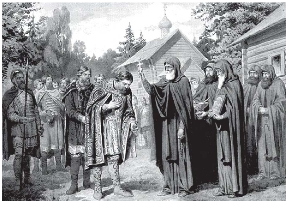
«Господь, меня готовя к бою...». Троице-Сергиев монастырь (ныне Лавра). Преподобный Сергей Радонежский вдохновляет князя Дмитрия Донского на брань с Ордой (художник Алексей Кившенко, конец XIX века). Через три с лишним столетия тут в минуты невзгод и борьбы укрывался молодой Петр.