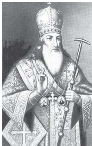
«И дух смирения, терпения, любви...». Святейший патриарх Иоаким (1620 — 1690), глава Русской православной церкви, поддержавший царя Петра против правительницы Софьи.

Поняв, что ухарским натиском монастырь не взять, а полупустое Преображенское никому не нужно, Софья впала в прострацию. Она молча сидела в зале, окруженная понурыми и недоумевающими стрельцами. Принесли бумагу от Петра с требованием дать отчет о ночных сборах стрелецких полков в Кремле и на Лубянке. Софья командировала в обитель боярина Ивана Троекурова с «полюбовным» призывом к брату срочно вернуться в Москву. Ответ оказался на редкость крутым: всем войсковым начальникам предписывалось прибыть к 18 августа в монастырь — для доклада государю. Взыгнанная царевна в ярости «отменила» указ, пригрозив послушникам немедленной казнь. Потом слегка успокоилась и, ударившись в ноги патриарху, умолила предстоятеля поехать в Троицу с кротким церковным увещанием.