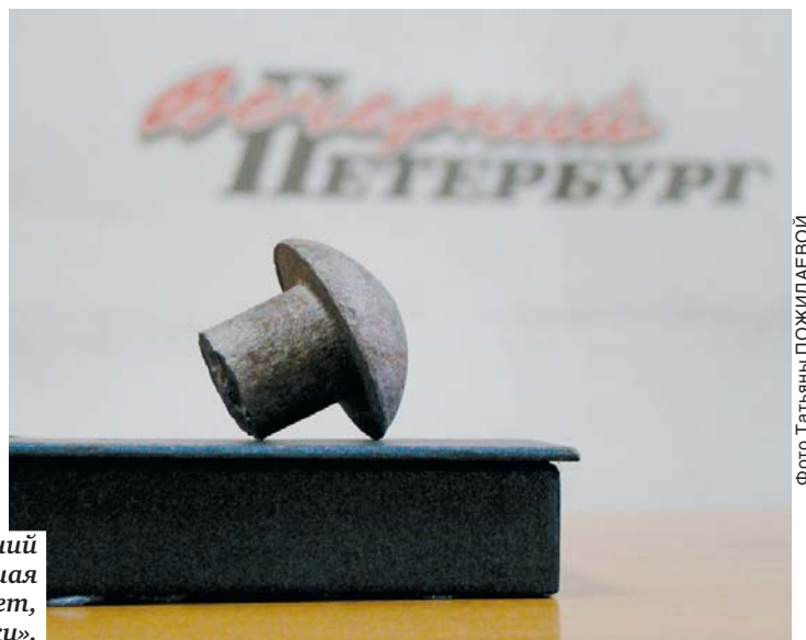
Заклепка из креплений Дворцового моста, прослужившая без малого 100 лет, попала в музей «Вечёрки».

РАЗВОДНОЙ МЕХАНИЗМ НЕ СОХРАНЕН, НО ЕГО ДЕЙСТВУЮЩАЯ МОДЕЛЬ ПЕРЕДАНА МУЗЕЮ ЖЕЛЕЗНОДОРОЖНОГО ТРАНСПОРТА