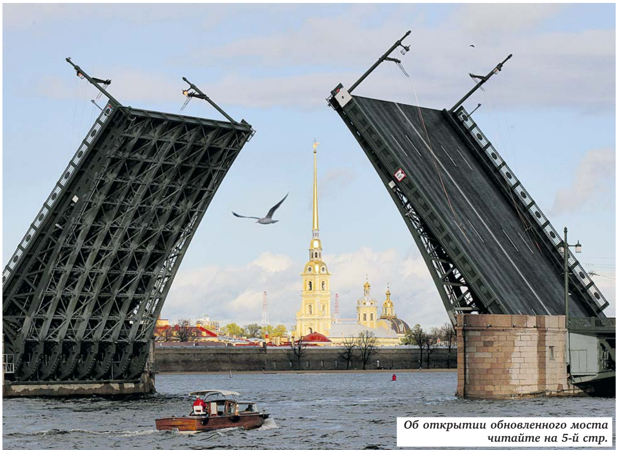
Об открытии обновленного моста читайте на 5-й стр.