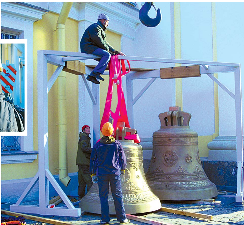
К счастью, площадка перед Троицким собором достаточно велика для проведения сложной операции подъема колоколов.

— Какими сложностями сопровождается подъем колоколов?