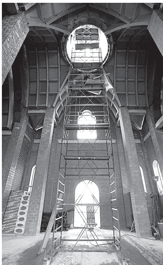
Церковь будет вмещать 400 прихожан. Жители близлежащих микрорайонов наконец обретут храм рядом с домом.

По оптимистичным прогнозам, храм планируется построить к следующему Дню рыбака — 13 июля 2014 года.