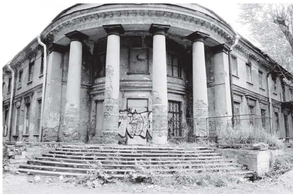
А этот образ из XXI века останется в историко-краеведческой экспозиции — символом вандализма.

Алла РЕПИНА