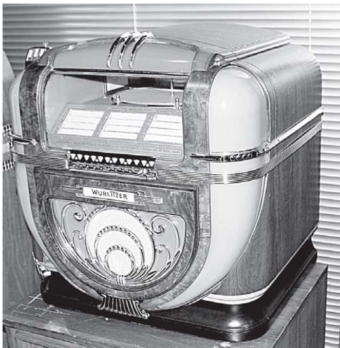
Не сразу поймешь, как играть на этом старинном автомате.