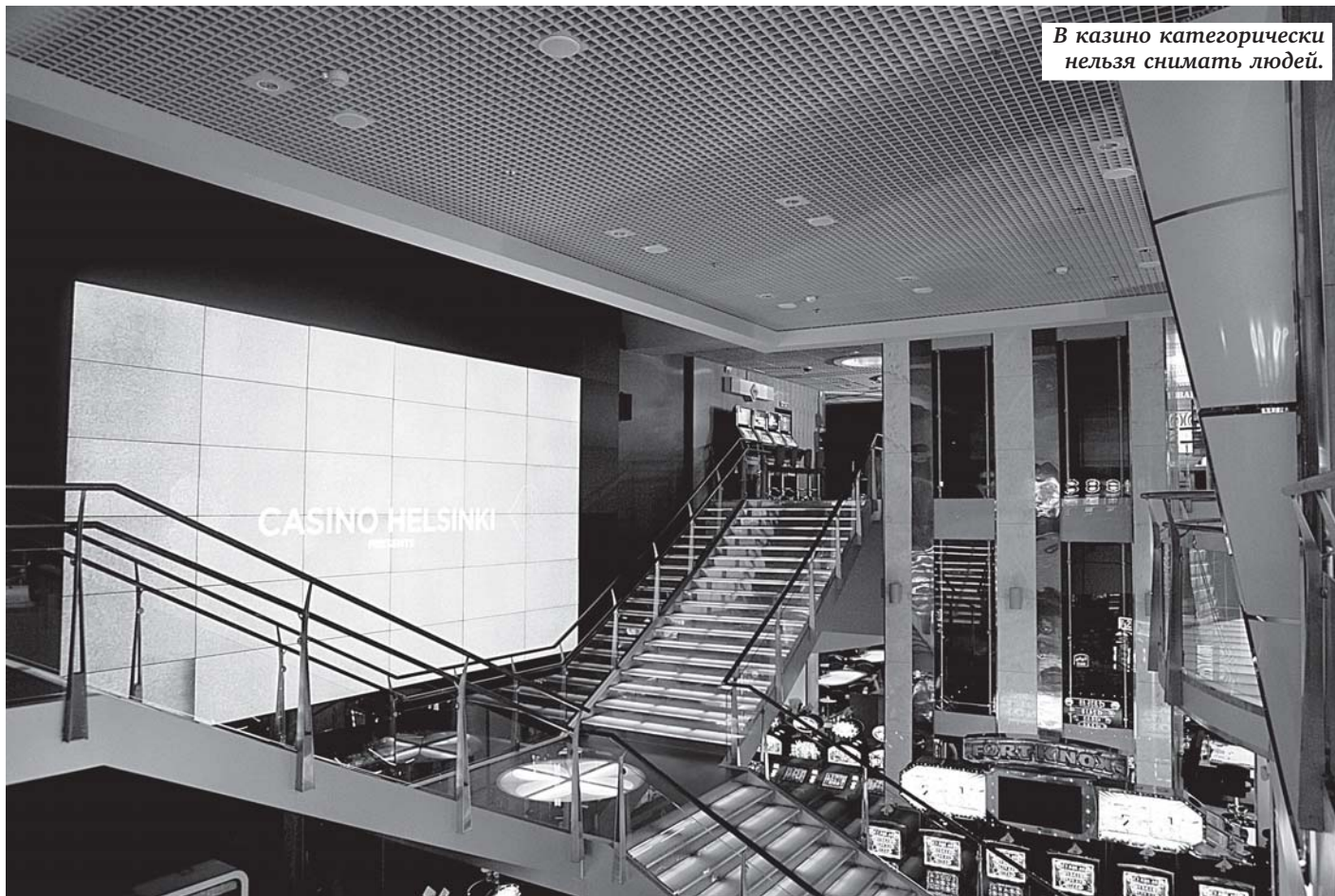
В казино категорически нельзя снимать людей.