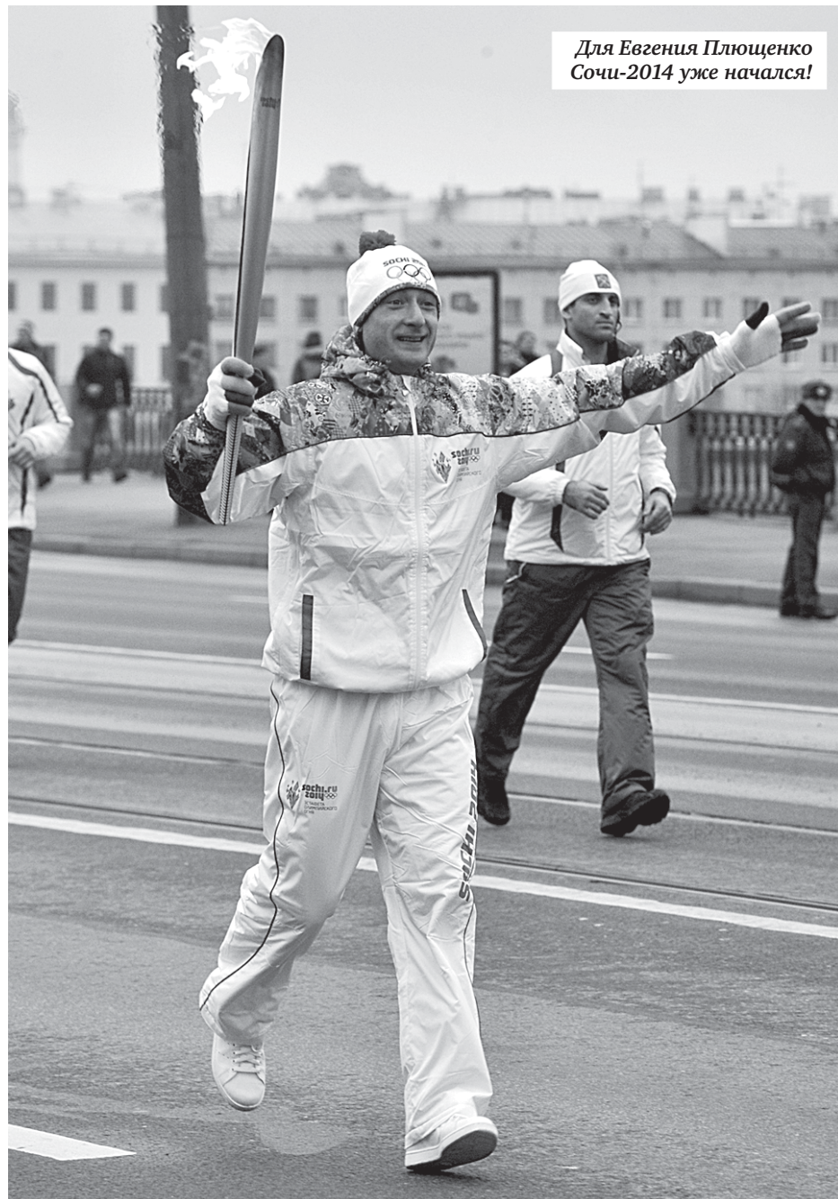
Для Евгения Плющенко Сочи-2014 уже начался!

Все страны Европы, кроме России, минувшей ночью дружно перешли на зимнее время. Теперь разница во времени с нашими ближайшими соседями — Финляндией, Прибалтикой, Белоруссией и Украиной — составляет два часа.