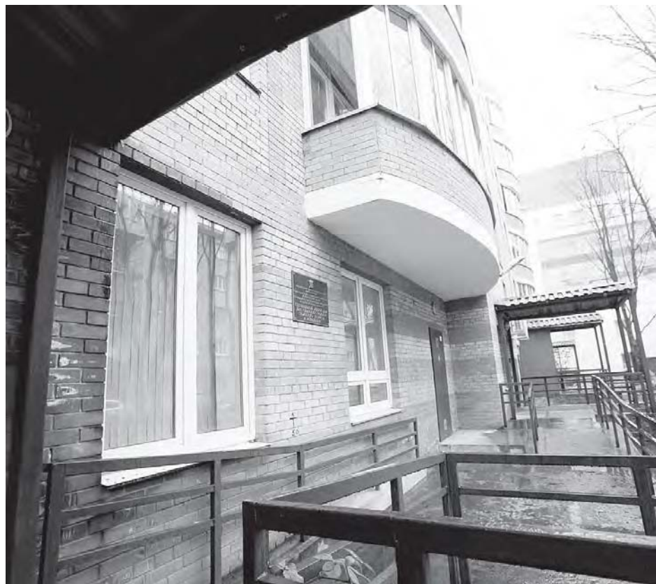
Дом красивый, кирпичный, теплый. Оборудован пандусами, большим лифтом.

для досуга пожилых людей. Можно, например, ходить на занятия по английскому языку, компьютерной грамотности, заниматься в зале лечебной гимнастики. Можно попробовать себя и в освоении караоке. И здесь же бывают танцы. Для жителей социального дома проводятся киносеансы и экскурсии.