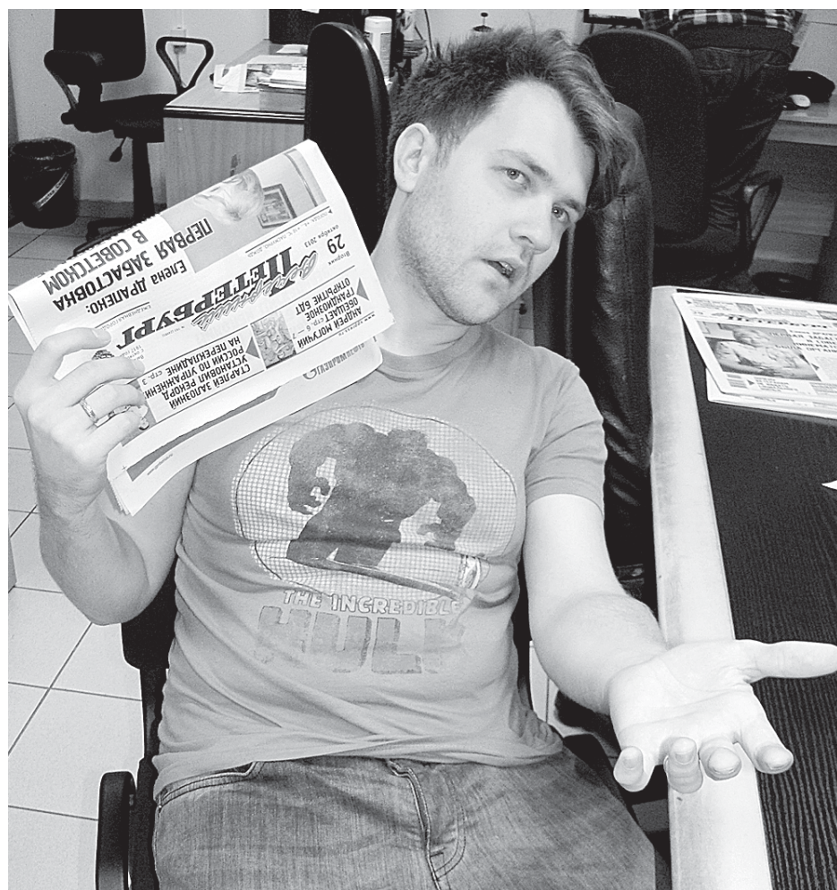
Зачем так топить, когда на улице плюс десять?!

— Если управляющая компания вовремя не среагировала на превышение температуры подачи тепла и не отрегулировала температуру внутри дома, то перетоп необходимо зафиксировать советом многоквартирного дома. Нормальная температура в квартире в среднем — плюс 20 градусов. Если 25 градусов и выше — фиксируем перетоп. Жители составляют акт. Идут с ним в управляющую компанию. И если общедомовой прибор учета покажет, что температура теплоносителя была выше, чем должна быть по температурному графику, то управляющая компания имеет право заявить о пе-