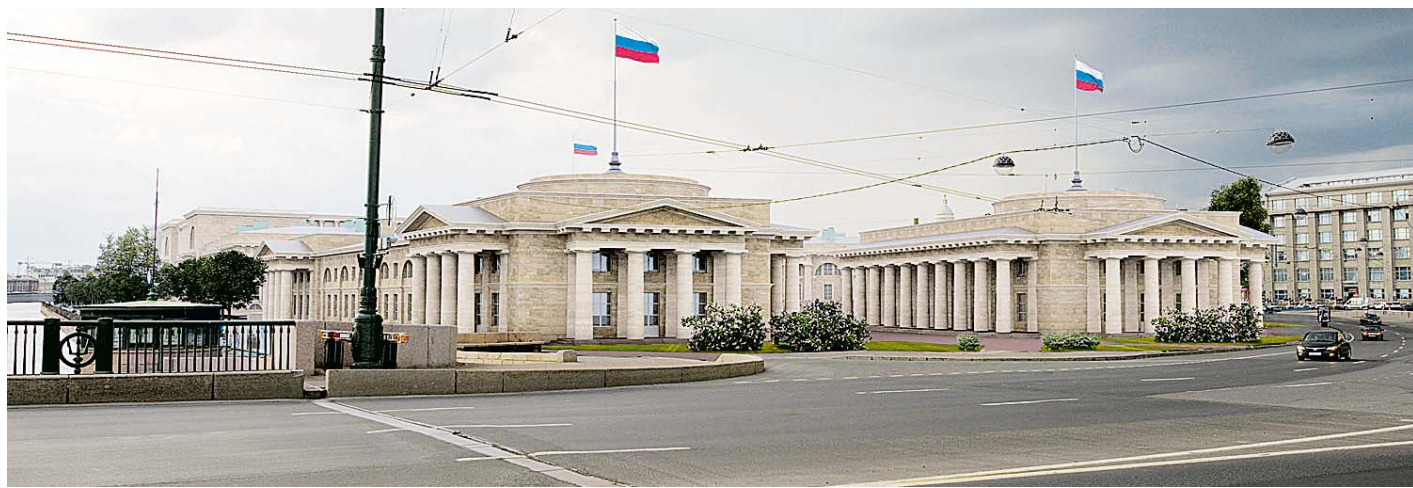
Судейские здания выполнены по типу конногвардейских манежей.

В субботу, 26 октября, из 21 члена комиссии на обсуждение прибыли 17. Три