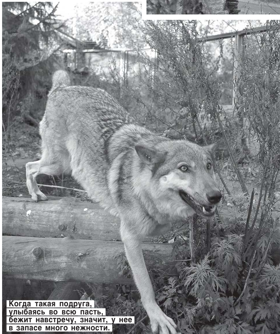
Когда такая подруга, улыбаясь во всю пасть, бежит навстречу, значит, у нее в запасе много нежности.

— Он всегда дикий и опасный. В отличие от домашнего этот зверь, даже в зоопарке, защищает свою территорию. Не считает человека своим хозяином: в лучшем случае люди для него — это существа, которых он принимает во внимание, иногда уважает или относится с симпати-