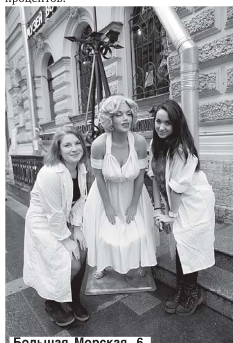
Большая Морская, 6.

роини Тургенева, напротив, — натуры страстные, своевольные, сильные. Сегодня о русском классике и его знаменитом романе в доме ничего не напоминает. Расположенный по соседству с Домом кино, он переполнен кафешками и ресторанами. В одном предлагается недорогой бизнес-ланч, афиша другого сообщает о том, что по средам здесь проводится день узбекской кухни. Мы с фотокором Чайкой хотели было рвануть в ресторан, дабы приобщиться к узбекской кулинарии, да вовремя вспомнили, что на дворе вторник. Рядом — кондитерская. Надпись на грифельной доске гласит, что всем, у кого на руках билеты в Дом кино, положена скидка 10 процентов.