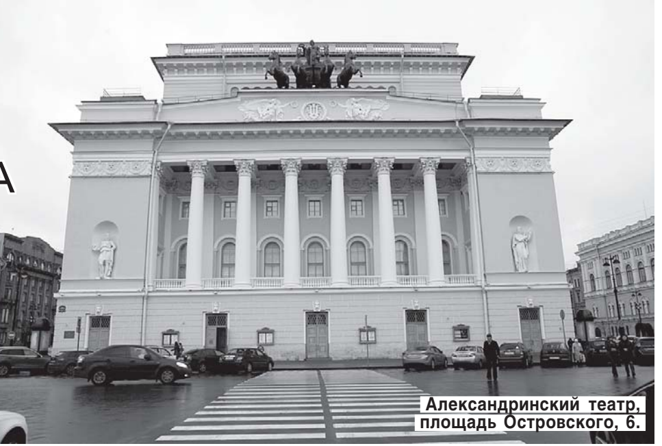
Александринский театр, площадь Островского, 6.