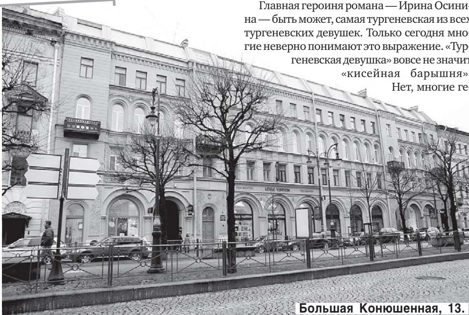
Большая Конюшенная, дом №13 ЗДЕСЬ БЫЛА НАПИСАНА «ПЕРВАЯ ЛЮБОВЬ»

Огромный красивый дом зеленовато-серого оттенка замечателен тем, что Тургенев снимал здесь квартиру с ноября 1858-го по апрель 1860 года. Здесь он окончил свой роман «Дворянское гнездо», начал работу над романом «Накануне», написал повесть «Первая любовь».