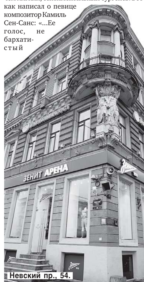
Невский пр., 54.

первый этаж сияет лазурно-голубым цветом: аж глазам больно. «Папа, смотри — «Зенит!» — восторженно кричит маленький мальчик, смущая интеллигентного отца. В доме — магазин, где продается зенитовская коллекция. Ступени, ведущие в это футбольное святилище, сверкают, феерят и переливаются, мигая вмонтированными в них голубыми лампочками. В витринах — огромные портреты футболистов, рядом — манекены, облаченные в зенитовскую униформу. Скромненько притулилась между футболистами серая мемориальная доска, извещающая о том, что в этом доме, в «демитовской» гостинице, в 1843 году русский классик Иван Сергеевич Тургенев познакомился с певицей Полиной Виардо-Гарсиа.