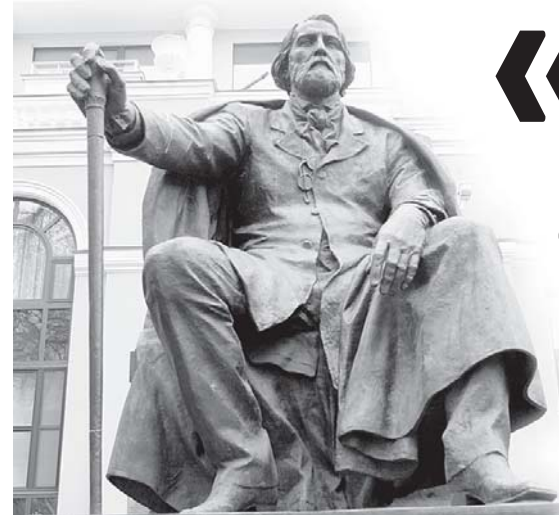
Манежная площадь НИ ЦВЕТОВ, НИ ТУРГЕНЕВСКИХ ДЕВУШЕК

9 НОЯБРЯ ИСПОЛНЯЕТСЯ 195 ЛЕТ СО ДНЯ РОЖДЕНИЯ ИВАНА СЕРГЕЕВИЧА ТУРГЕНЕВА