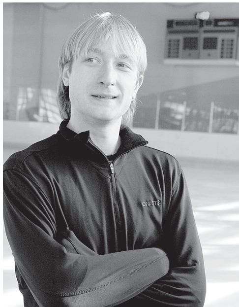
После тяжелой травмы Женя почти 10 месяцев не участвовал в соревнованиях.

Евгений Плющенко триумфально вернулся на лед: наш земляк в блестящем стиле выиграл международный турнир в Риге «Volvo Cup», превзойдя личные рекорды в произвольной программе (180,91 балла) и в сумме за две программы (263,25). В короткой программе он также стал первым (82,34 балла). Следующий старт олимпийского чемпиона намечен на московском этапе «Гран-при» «Кубок Ростелекома», который состоится с 22 по 25 ноября.