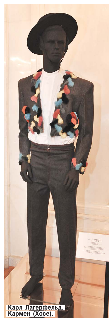
Карл Лагерфельд. Кармен (Хосе).