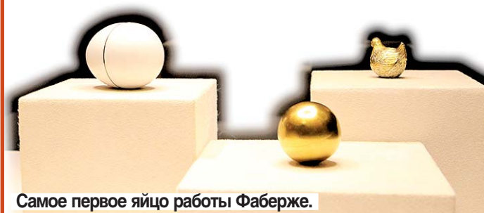
Самое первое яйцо работы Фаберже.

Так это яйцо, а вместе с ним и многие другие драгоценности русских императоров и аристократов, спустя без малого сто лет вернулись в Россию, в Петербург.