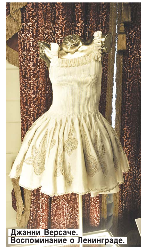
Джанни Версаче. Воспоминание о Ленинграде.