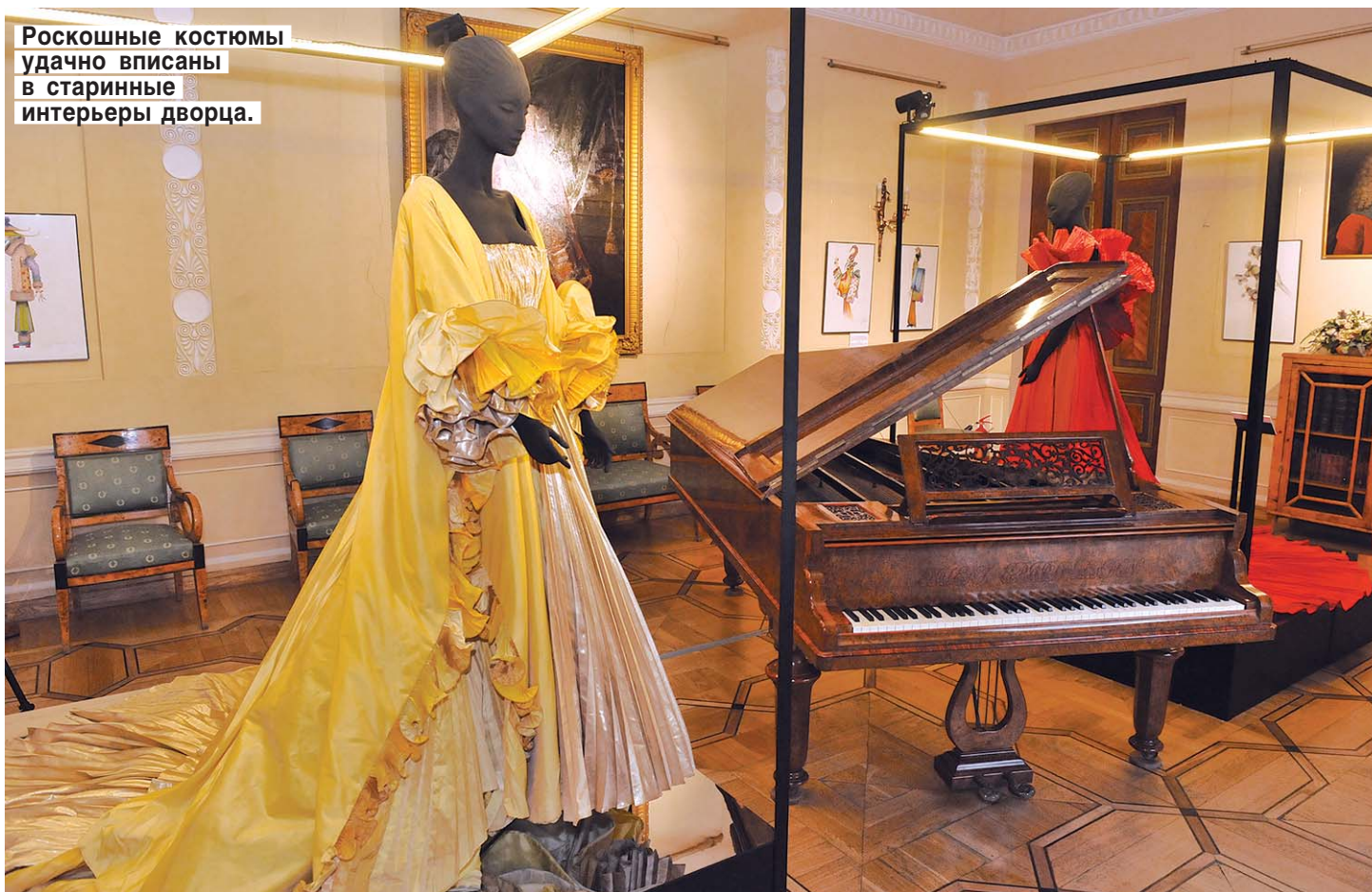
Роскошные костюмы удачно вписаны в старинные интерьеры дворца.

Он создал выставку грандиозную, монументальную, очень пафосную, очень гламурную... Смысл этого слова — «глумур», которое так часто употребляется глянцевыми журналами, — в России понимается чаще всего неправильно. Гламур — это то, что вы видите здесь.