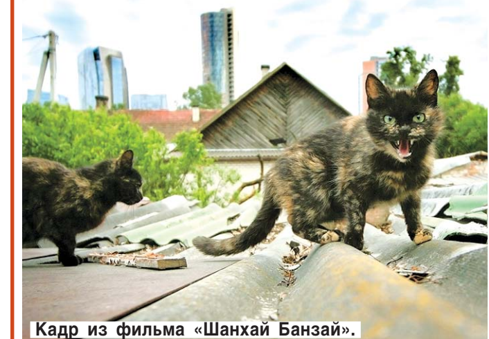
Кадр из фильма «Шанхай Банзай».