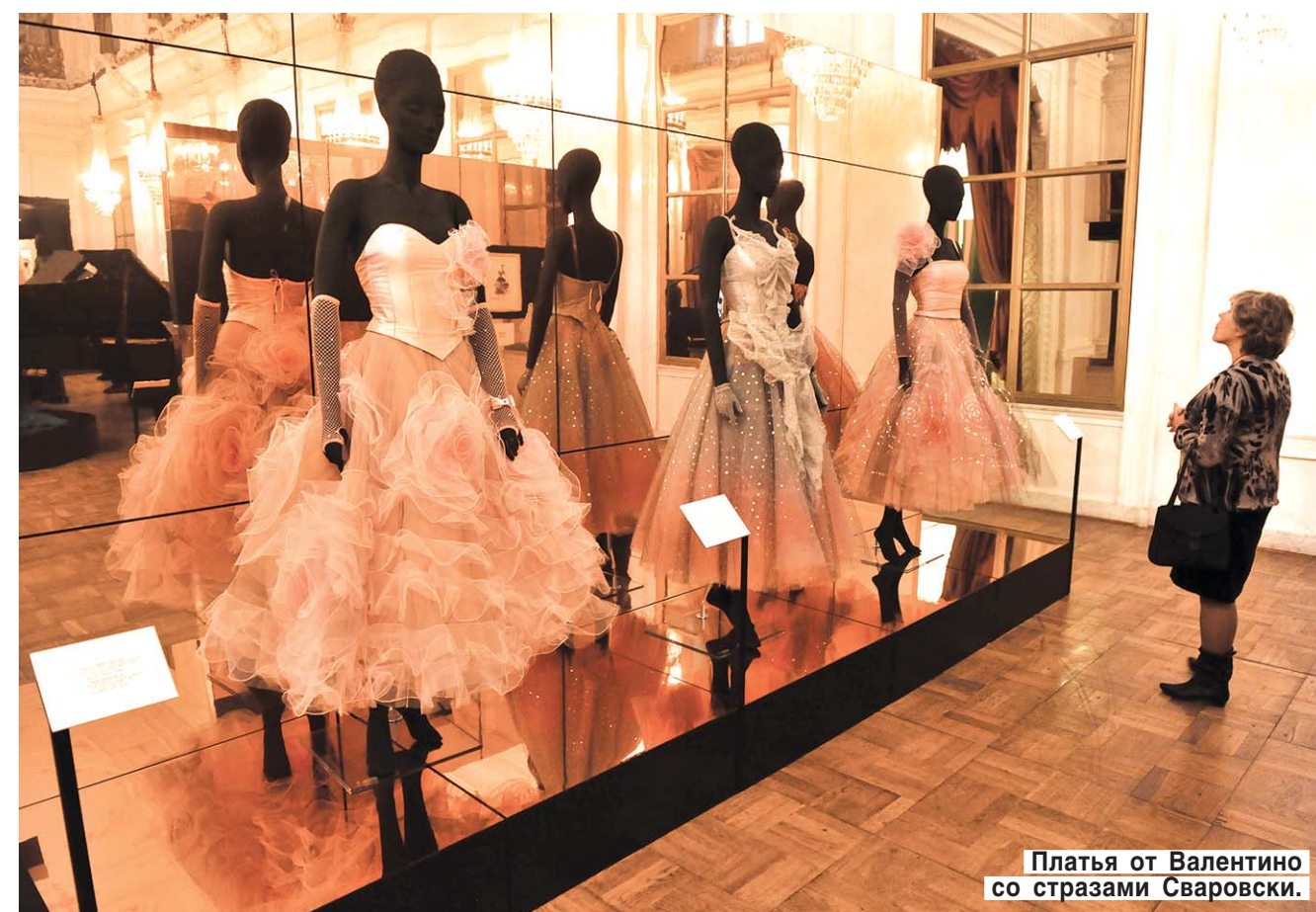
Платье от Валентино со стразами Сваровски.

Еще одна деталь: в Шереметевском дворце очень много зеркал — старинных, чуть затуманенных. Массимо Маркомини виртуозно обыграл тему зеркал. Множество подиумов, на которых стоят облаченные в театральные костюмы манекены, тоже зеркальные. Только, конечно, эти зеркала совсем новенькие, блестящие. Своеобразными зеркалами выглядят и плазменные экраны, на которых в режиме нон-стоп крутят оперы и балеты. Вот платье какой-нибудь оперной примадонны, надетое на манекен, а на экра-