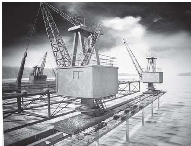
Горизонтальное колесо обозрения можно устроить на портовых кранах.

— Жители должны понять, что сам по себе парк вряд ли возможен, а мемориальная функция поможет сохранить зеленую территорию острова, — высказала моло-