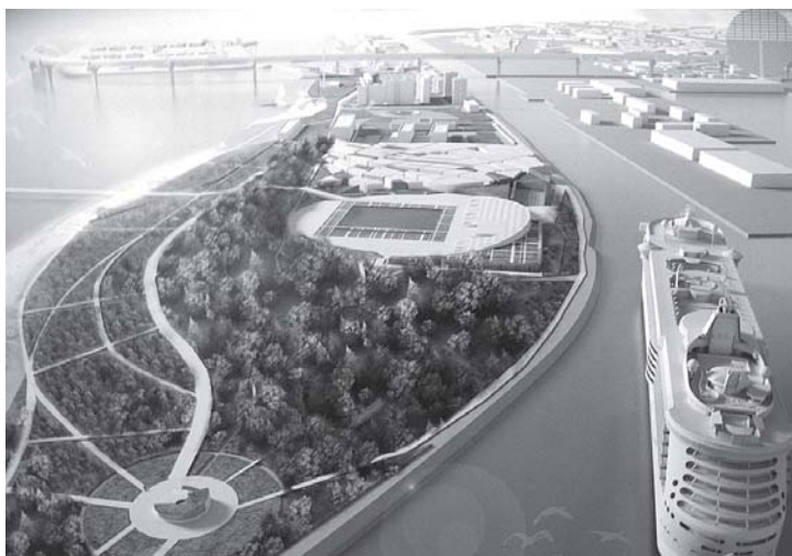
Проект «Парк памяти»: Сан-Микеле Северной Венеции.

Спокойной жизни жителям Канонерского острова не видеть — сегодня они обитают на грандиозной стройке. Вдоль жилой зоны острова сооружается участок Западного скоростного диаметра (ЗСД). Двухъярусная эстакада протяженностью примерно 330 метров поднимется до 42 метров от поверхности земли, спусков на остров иметь не будет. Под ее транзит городом решено расселить и снести четыре жилых здания. «Непригодными для проживания» в защитной зоне эстакады признаны многоквартирные дома по адресам: Канонерский остров, дом №12, корп. 2, Канонерский остров, дом №15, Канонерский остров, дом №16, и Канонерский остров, дом №17.