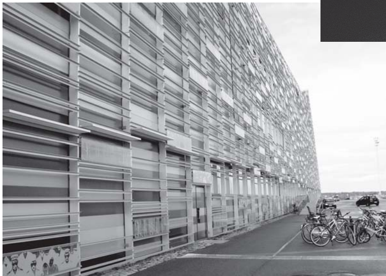
Морской музей Велламо, Котка.

Легкое волнение в ровный тон встречи внесло предложение Михаила Пиотровского о совместном исследовании затонувшего на дне Балтики корабля «Фрау Мария» («Vrouw Maria»). Как известно, судно, которое перевозило из Амстерда-