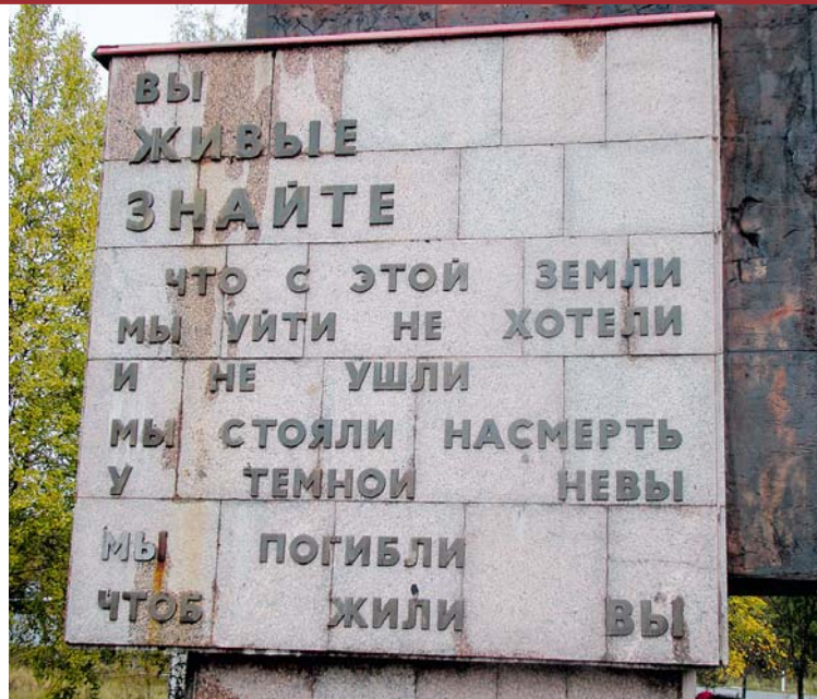
«Рубежный камень» на Невском пятачке нуждается в реставрации.