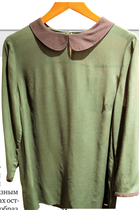
Изумрудно-зеленая блуза с черным воротничком сделает вас похожей на Катрин Денёв.

Один из самых известных костюмов, до сих пор оказывающих влияние на моду, строгое черное платье с отложным воротничком и манжетами из белого атласа. Сегодня такие воротнички вновь на пике моды. В одном бутике ваши корреспонденты обнаружили роскошные шелковые блузы, которые вполне подошли бы Северине: темно-синяя, с белым воротничком, и изумрудно-зеленая, — с черным. В бутике везде маячили бдительные охранники, и нам пришлось удалиться с блузками в примерочную, где и удалось их сфотографировать. Руки так и чесались купить одну из блузочек. Остановила цена — 5 тысяч рублей. Подождем скидок.