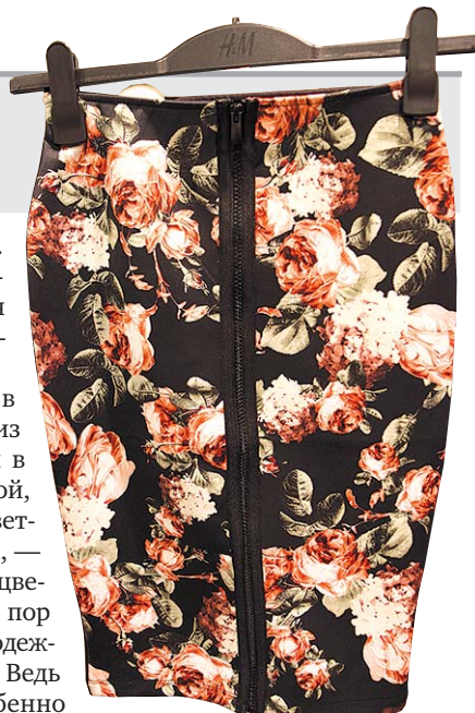
Юбка-карандаш в цветочек.

радуют душу. Нынешней зимой цветочные принты встречаются и в вечерней, и даже в деловой одежде.