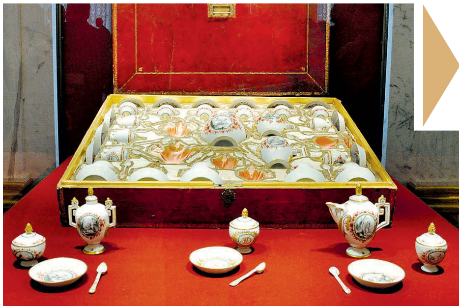
В сервизе, состоящем из 86 предметов, не хватает трех ложек и одной чашки.

По традиции в последний день уходящего года Эрмитаж устраивает выставку новых поступлений, на которой показывает самые интересные произведения искусства, приобретенные им.