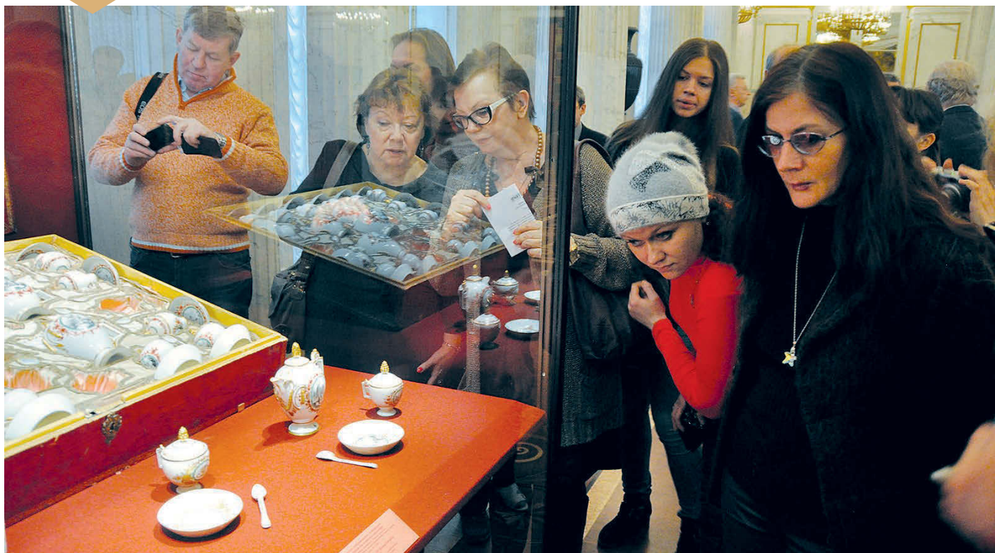
Уникальный сервиз, приобретенный на закрытых торгах «Сотбис», обошелся музею в немалую сумму.