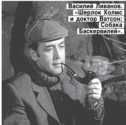
Василий Ливанов. «Шерлок Холмс и доктор Ватсон: Собака Баскервиль».

ПУТЕМ СЛОЖНЫХ ИССЛЕДОВАНИЙ С ИСПОЛЬЗОВАНИЕМ МЕТОДА ДЕДУКЦИИ ТОЧНО УСТАНОВЛЕНО, ЧТО ЗНАМЕНИТЫЙ СЫЩИК РОДИЛСЯ ПРИМЕРНО 6 ЯНВАРЯ 1854 ГОДА