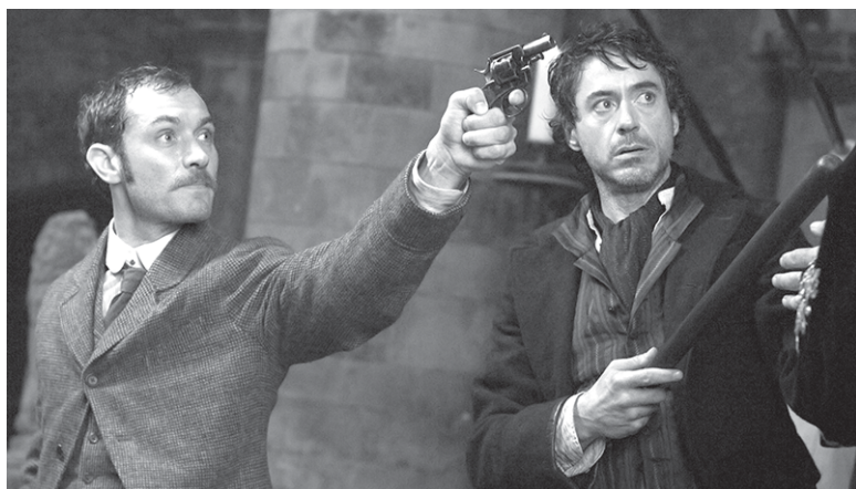
Джуд Лоу и Роберт Дауни-младший. «Шерлок Холмс».

Пока мы писали о Холмсе, пришла новость: суд в США отказал фонду наследия писателя Артура Конан Дойла в обладании правами на образы Шерлока Холмса и доктора Ватсона. Представители фонда ранее неоднократно требовали отчисления за использование образов Холмса и Ватсона.