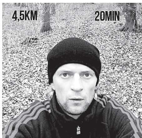
Анатолий Тимощук набирает форму после новогодних праздников.

роль чемпионки исполняет актриса Светлана Ходченкова, которая до этого никогда не была на Олимпиаде.