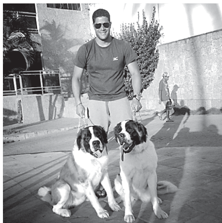
Халк и его псы.

А Халк (@HulkGivanildo_V) о грустном не думает. Выложил в «Твиттере» и