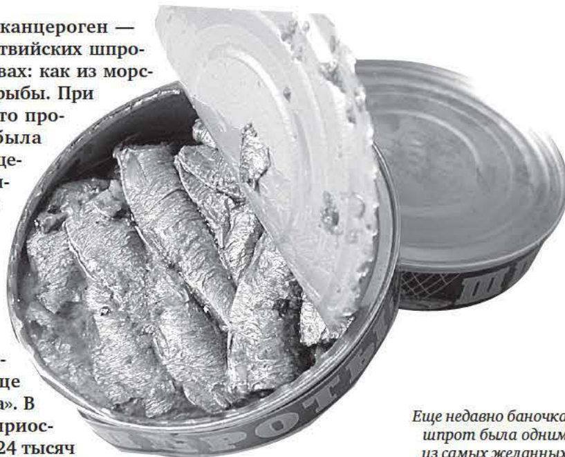
Еще недавно баночка шпрот была одним из самых желанных деликатесов.

Бензопирен — химический канцероген — Роспотребнадзор нашел в латвийских шпротах, а также в других консервах: как из морской, так и из пресноводной рыбы. При этом ведомство сообщает, что проверка рыбных консервов была предпринята «в связи с обращениями граждан, поступившими на имя президента Российской Федерации В. В. Путина 12 декабря 2013 года в Единый день приема граждан». Под подозрение в ненадлежащем качестве попала в основном продукция ООО «Kolumbija Ltd» из Лиепая, продающаяся в рознице под торговой маркой «Либава». В московских гипермаркетах приостановлена реализация более 24 тысяч банок этих консервов. Проводятся дополнительные исследования.