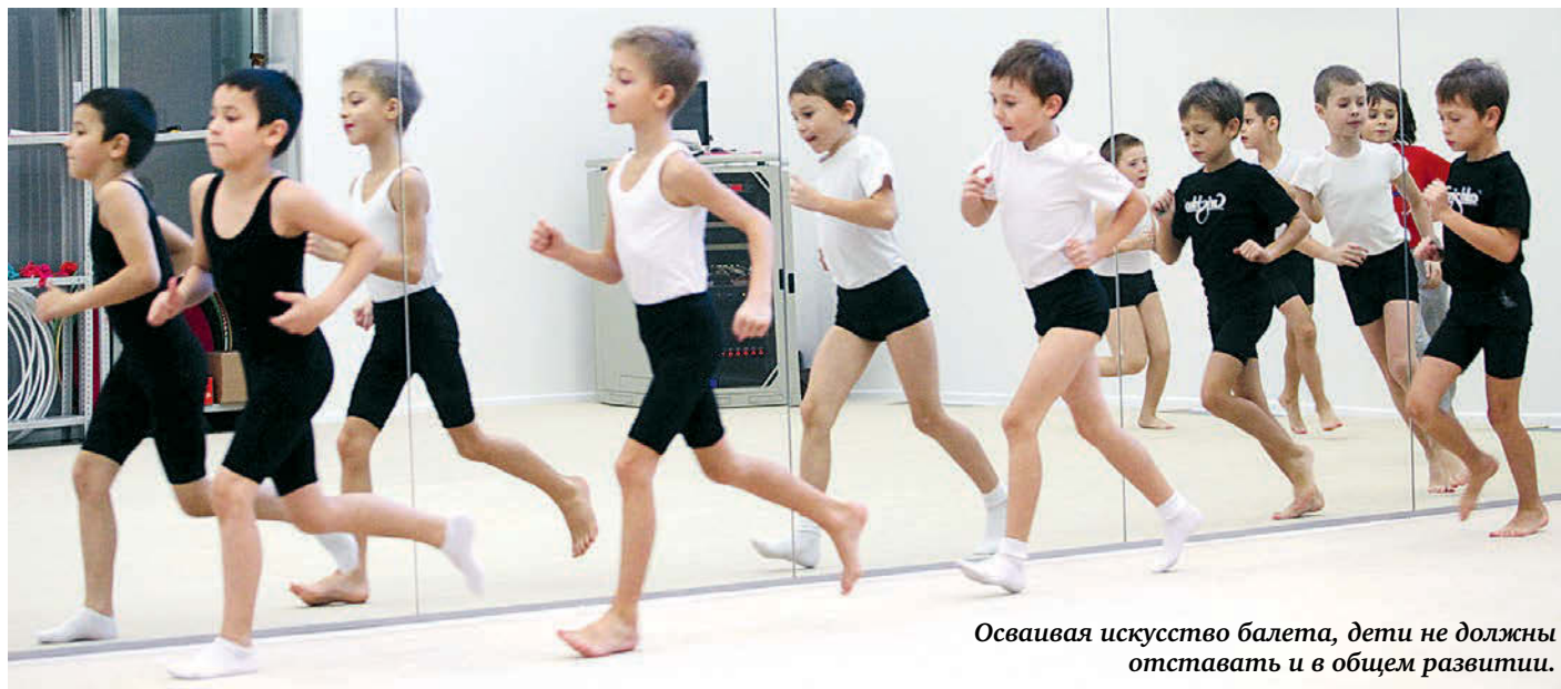
Осваивая искусство балета, дети не должны отставать и в общем развитии.

В академии подчеркнули, что у них большие планы развития. В деревянном здании — памятнике архитектуры, особ-