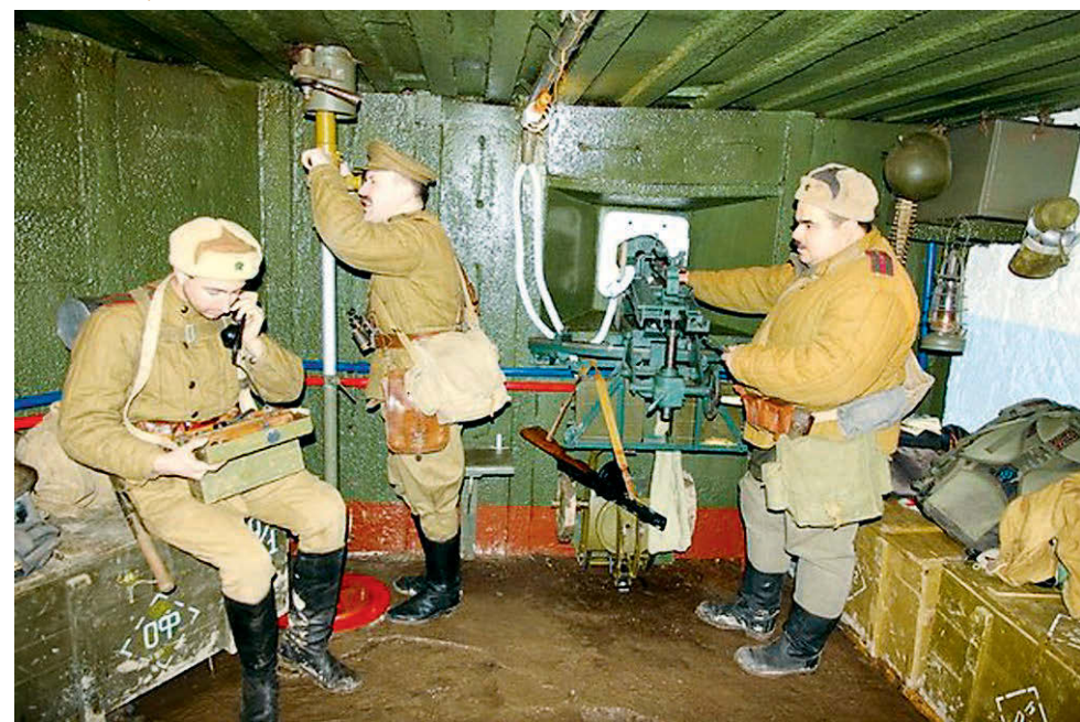
Члены клубов военно-исторической реконструкции — активисты восстановления памятника.