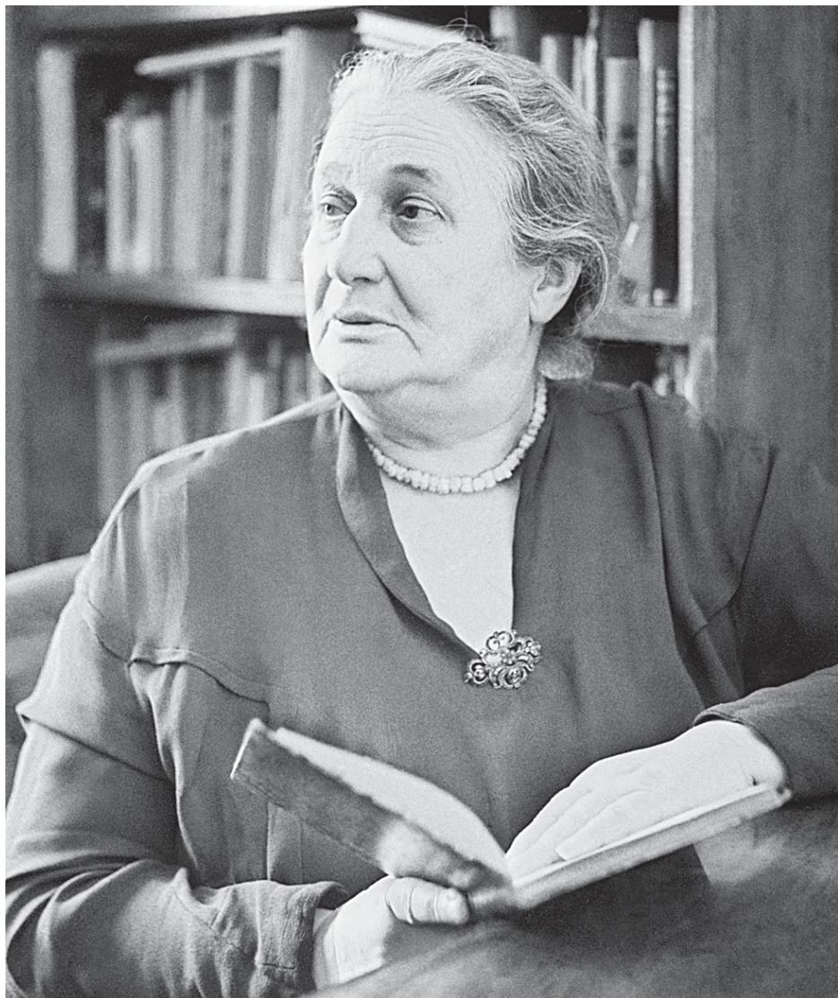
В августе 1946 года вышло постановление Оргбюро ЦК ВКП(б) о журналах «Звезда» и «Ленинград», в котором Михаил Зощенко был назван пошляком и подонком литературы, а Анна Ахматова — типичной представительницей чуждой народу пустой и безыдейной поэзии.