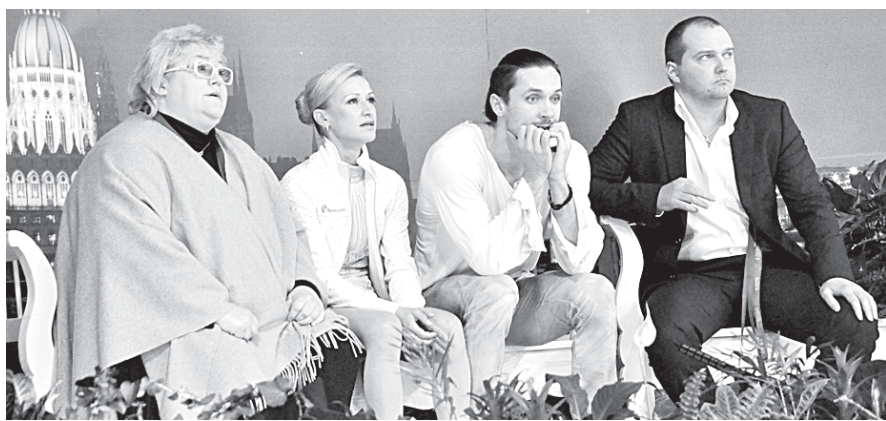
Татьяна Волосожар — Максим Траньков в Будапеште удивили.