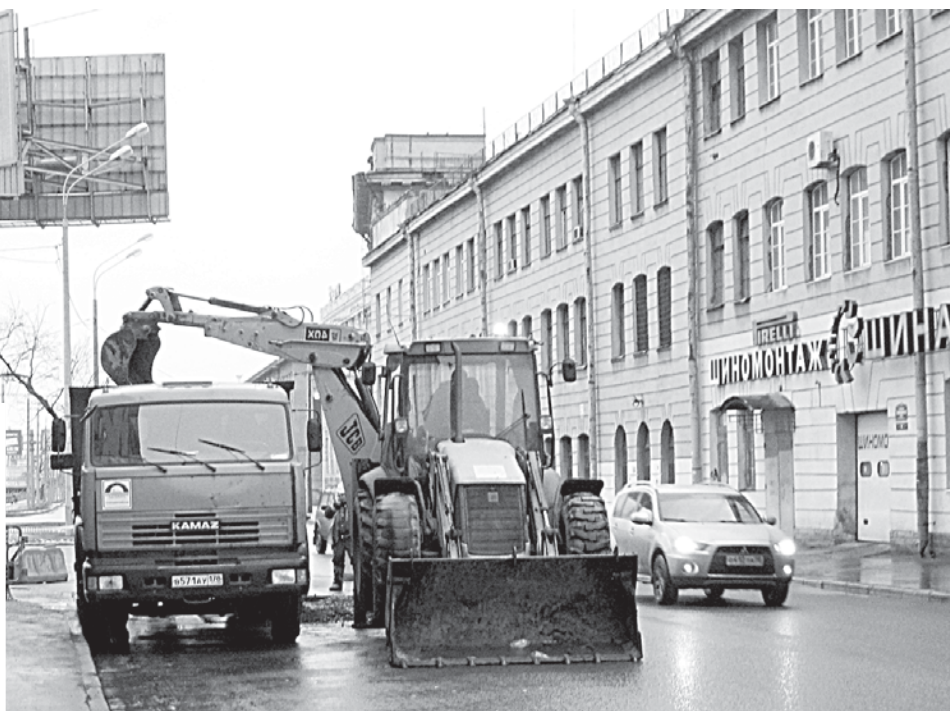
Из-за постоянных прорывов страдают и автомобилисты, чей путь лежит по многострадальной улице Константина Заслонова.

Как сообщили работники аварийной службы, напротив дома №3 электрики прокладывали кабель, рвали котлован, заделали магистральный трубопровод диаметром полметра. Сами устранить последствия сотрудники ЗАО «Электрострой» не смогли. Прорыв тут же приобрел масштабы стихийного бедствия. Улица почти сразу превратилась в озеро. Вода хлынула во дворы и переулки, а аварийные службы на помощь жителям не спешили».