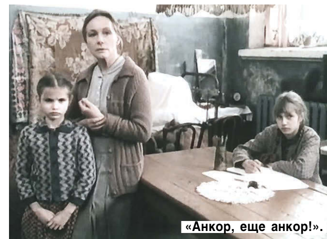
«Анкор, еще анкор!».

— Очень редко. Она живет в Москве, а я в Петербурге, но я навсегда сохранила к ней очень добрые и теплые чувства, надеюсь, и