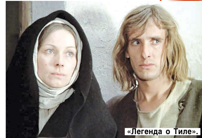
«Легенда о Тиле».

делается инфантильной. Но иногда женщины мучаются совершенно напрасно. И у моей мамы была пытка, а не жизнь. Мы, дети, а нас в семье было четверо — три сестры и брат, просили ее: «Мама, брось его!» А она нам: «Как я вас прокормлю?» — «Так папа же все равно деньги пропивает!» — упрасивали мы. Папа работал водителем троллейбуса в Краснодаре, куда мы пере-