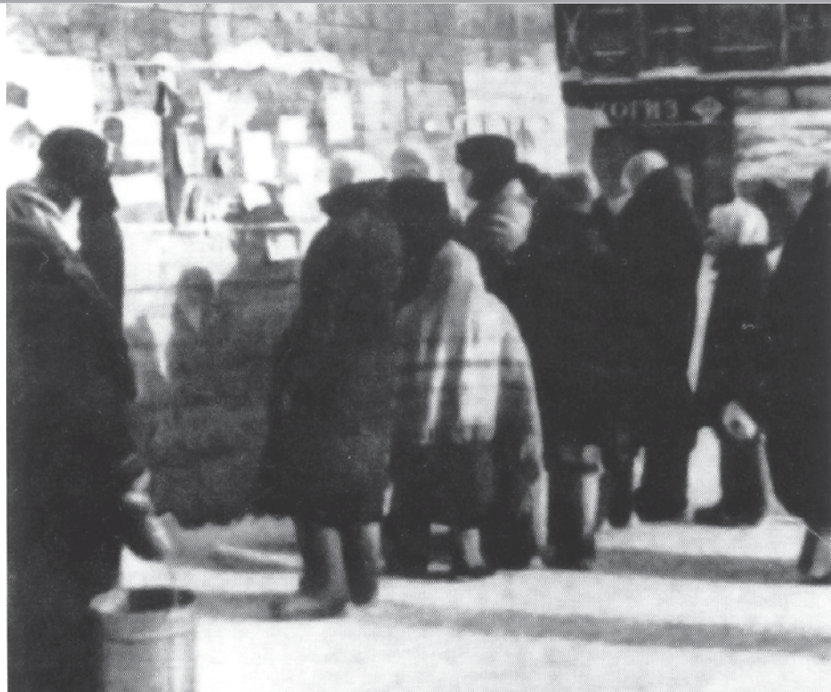
Доска объявлений. Здесь можно было купить Левитана.