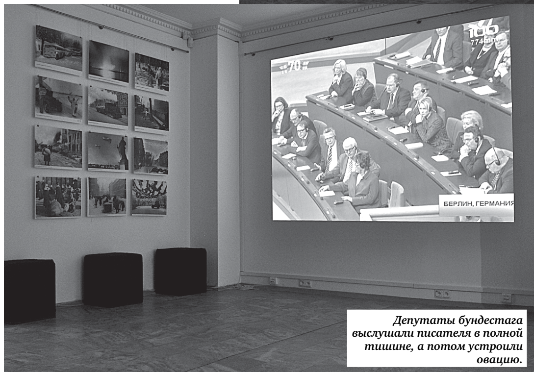
Депутаты бундестага выслушали писателя в полной тишине, а потом устроили овацию.

МЕРОПРИЯТИЕ это проводится ежегодно с 1996 года и приурочено к годовщине освобождения гитлеровского концентрационного лагеря Освенцим войсками Красной армии 27 января 1945 года. В этом году оно проходит под знаком памяти жертв блокады Ленинграда. Даниил Гранин, переживший блокаду, которая была полностью снята ровно 70 лет назад, выступил с речью.