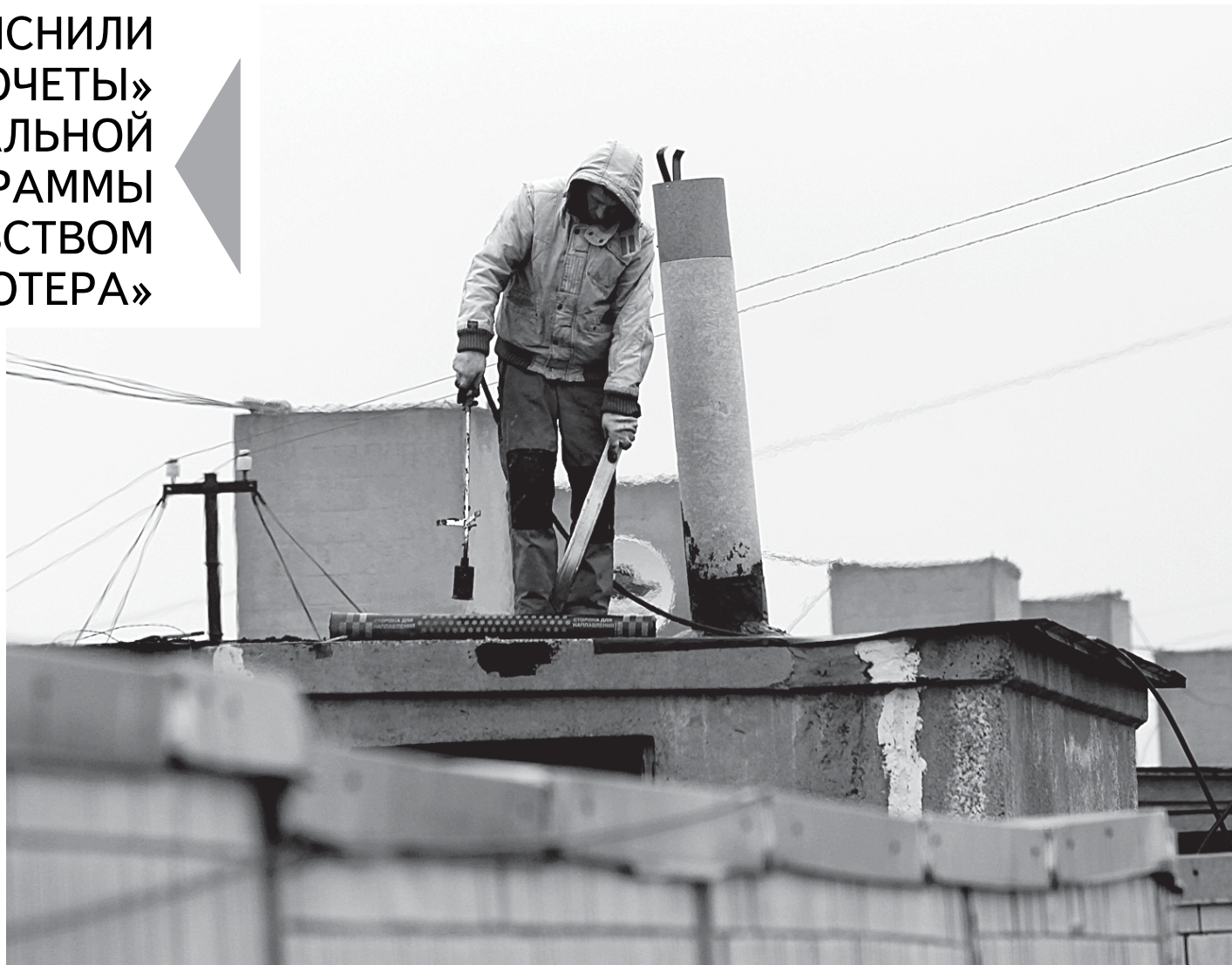
Ремонт кровель нужно проводить раз в 10 или 15 лет, в зависимости от использованного вида металла.

Впрочем, в программу капремонта, по словам Дмитрия Локтаева, вкрались еще и ошибки, которые имеют системный и массовый характер. По его словам, в до-