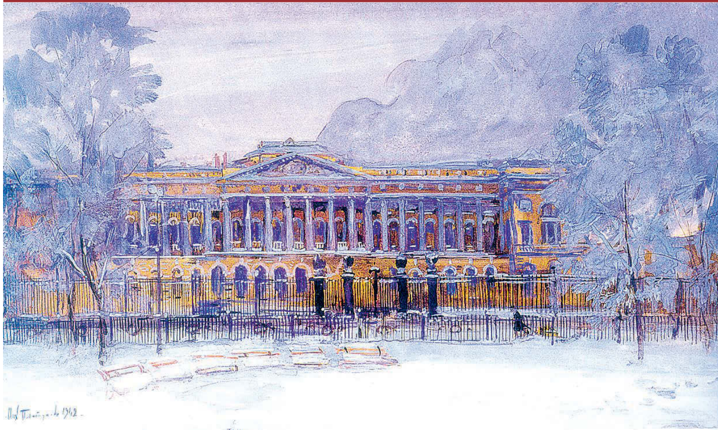
Платунов М. Г. Русский музей.